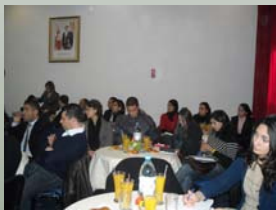
Petit Déj; 10 février 2009

La responsable a énuméré, en outre, d'autres lignes de crédit extérieures comme la ligne de crédit espagnol, le don de la région Wallone de Belgique, la ligne de crédit de la JBIC, la ligne de crédit italienne, la ligne de crédit portugaise et la ligne de crédit Saudi Fund for Développement